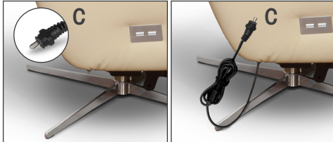
TV-Sessel mit Akku

Für die Inbetriebnahme und Nutzung der motorischen Funktionen schließen Sie zuerst das Netzteil (A) an den Verbindungsstecker (C) des TV-Sessels an und verbinden anschließend das Steckerkabel (B) mit dem Netzteil und der Steckdose.